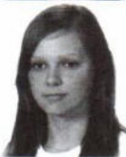
Charysz Zofia zam. Łazy Zespół Szkół Drogowo - Geode- zyjnych i Licealnych im. Augusta Witkowskiego w Jarosławiu