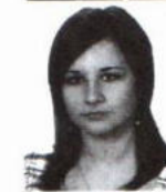
Kuta Amelia zam. Mięksiz Nowy Gimnazjum w Laszkach