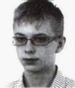
Półtorak Przemysław zam. Jankowice I Liceum Ogólnokształcące im. Mikołaja Kopernika w Jarosławiu