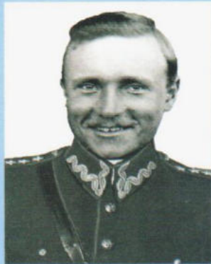
Tadeusz Zieliński (1893 - 1940)