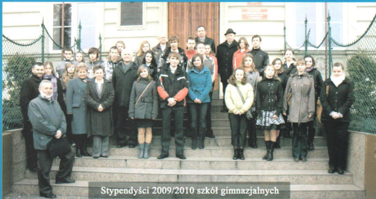
Stypendiści 2009/2010 szkół gimnazjalnych