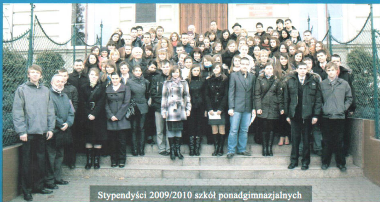
Stypendiści 2009/2010 szkół ponadgimnazjalnych