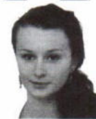
Cynk Aleksandra zam. Tyniowice Zespół Szkół Drogowo - Geode- zyjnych i Licealnych im. Augusta Witkowskiego w Jarosławiu