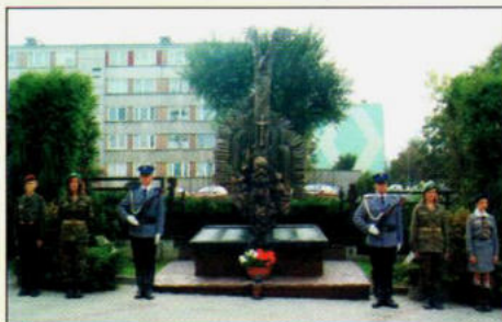
Obchody rocznicowe przy Pomniku Katyńskim str. 3 - 4