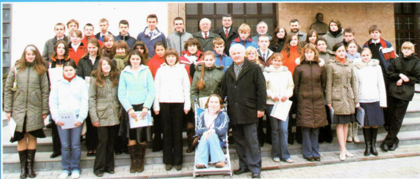
Stypendyści 2006 / 2007 szkół gimnazjalnych.