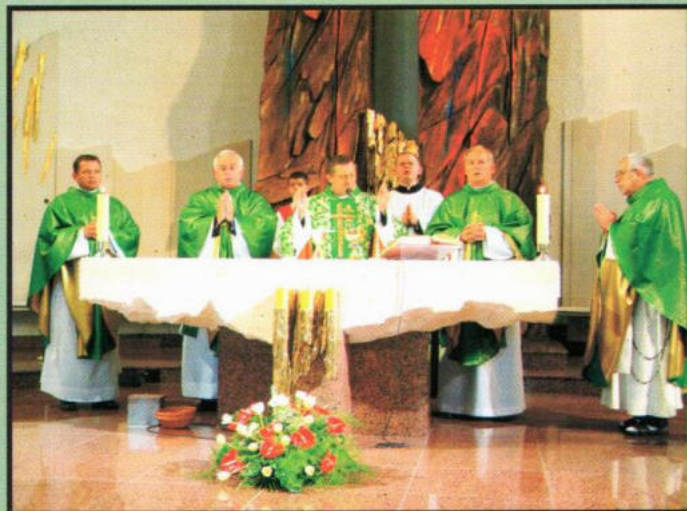
Uroczysta Msza św. w pierwszą rocznicę poświęcenia Pomnika Katyńskiego.