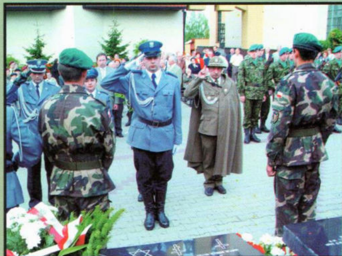
Składanie wiązanek kwiatów pod Pomnikiem Katyńskim.