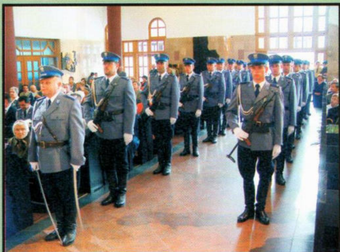
Kompania honorowa Policji podczas Mszy św.