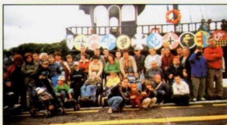
Podsumowanie działalności Fundacji za 2006 rok str. 16 - 18