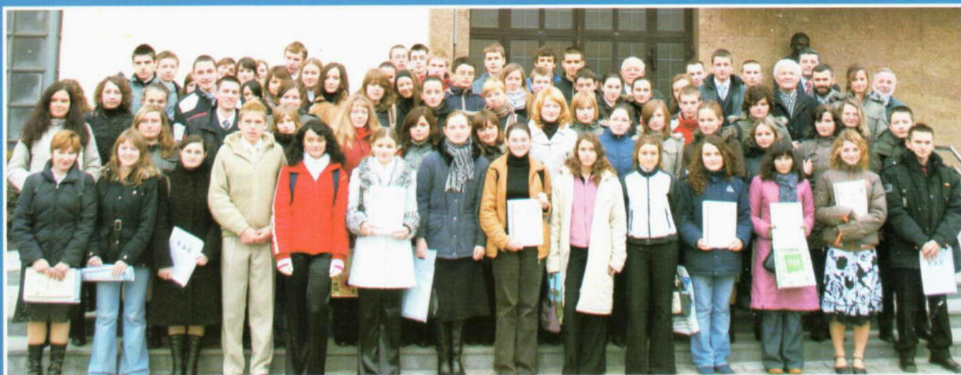
Stypendyści 2006 / 2007 szkół ponadgimnazjalnych.