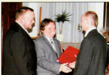
XV - lecie Fundacji" str. 5 - 6