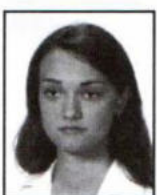
KNARA BEATA zam. Jarosław, Zespół Szkół Technicznych i Ogólnokształcących w Jarosławiu