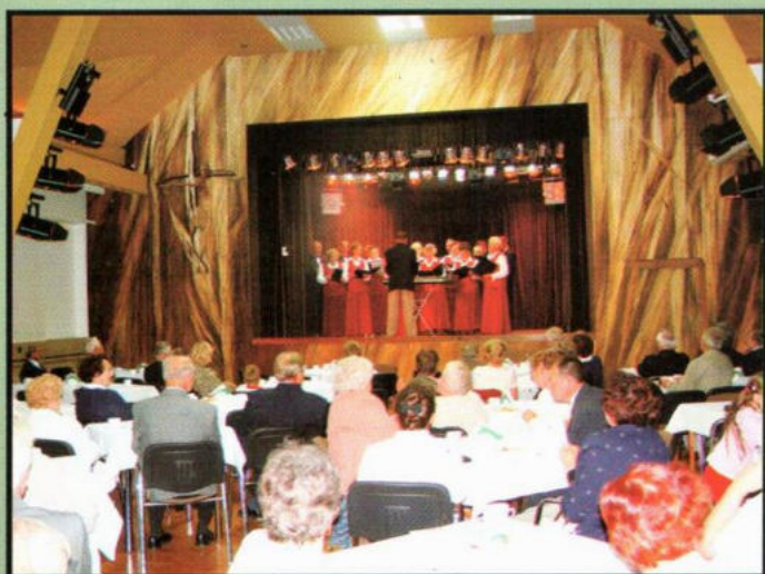
Chór z Trynicy podczas koncertu pieśni patriotycznych w KCK.