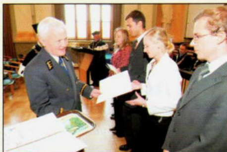
Stypendia 2006 / 2007 str. 7 - 14