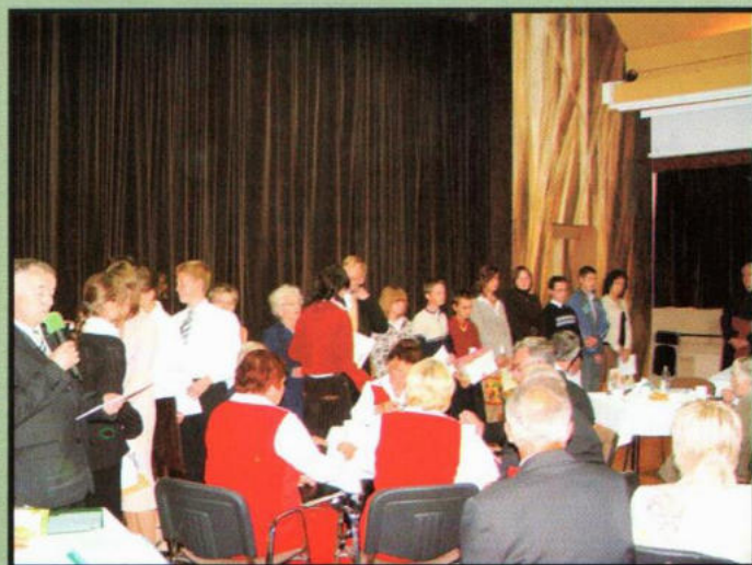
Wręczenie nagród uczestnikom konkursu "Katyń - Sybir - przebaczymy, ale pamiętamy".