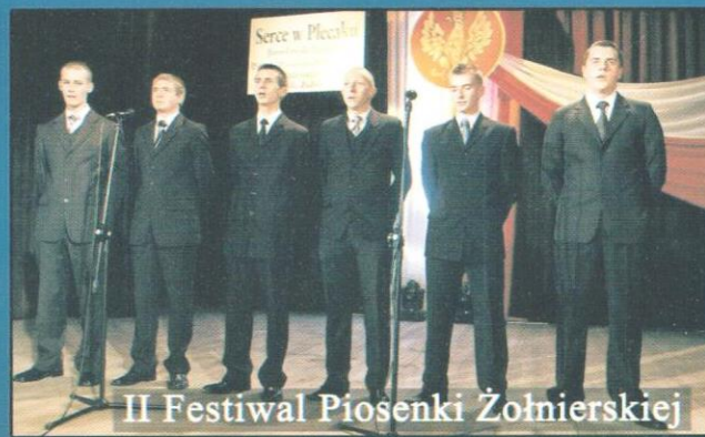
II Festiwal Piosenki Żołnierskiej