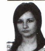
Kuta Amelia zam. Mięksiz Nowy Gimnazjum w Laszkach