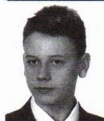
Kot Kacper zam. Jarosław Publiczne Gimnazjum Nr 4 w ZSO im. Książąt Czartoryskich w Jarosławiu