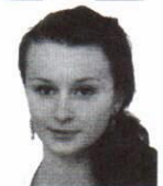
Cynk Aleksandra zam. Tyniowice Zespół Szkół Drogowo - Geode- zyjnych i Licealnych im. Augusta Witkowskiego w Jarosławiu