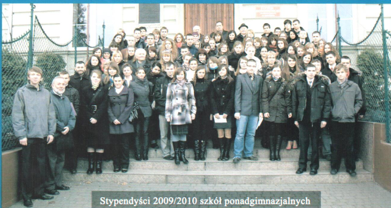
Stypendyści 2009/2010 szkół ponadgimnazjalnych