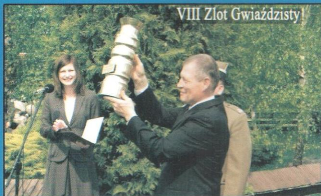
VIII Złot Gwiazdzisty