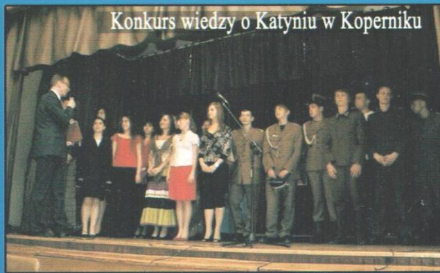
Konkurs wiedzy o Katyniu w Koperniku