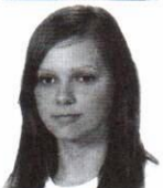
Charysz Zofia zam. Łazy Zespół Szkół Drogowo - Geode- zyjnych i Licealnych im. Augusta Witkowskiego w Jarosławiu