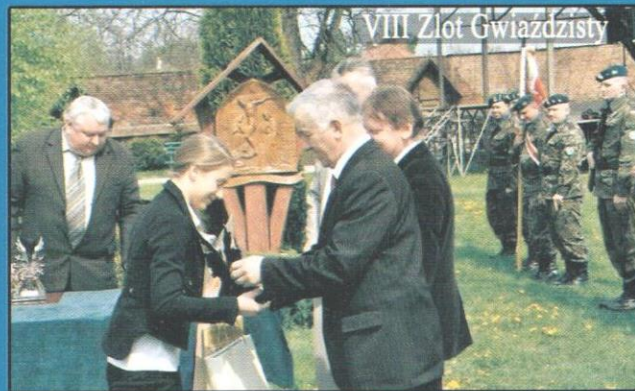
VIII Złot Gwiazdzisty