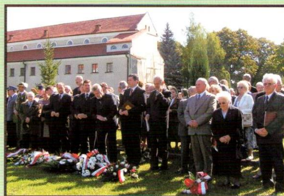
Obchody "Dnia Sybiraka" - 2007