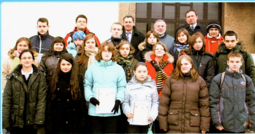
Stypendyści 2007 / 2008 szkół gimnazjalnych.