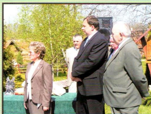
VI Złot Gwiazdzisty