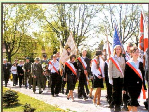
VI Złot Gwiazdzisty