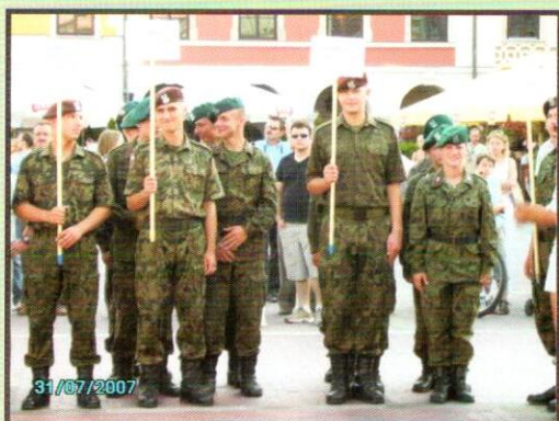
Strzelcy z JS2025 w Zamościu