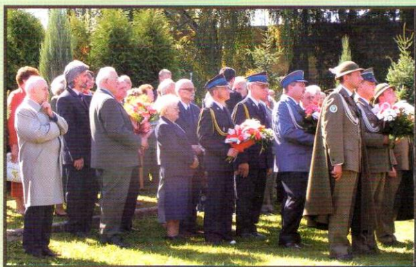
Obchody "Dnia Sybiraka" - 2007