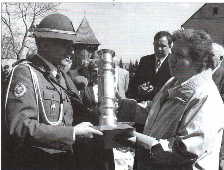
Wręczenie Pucharu Dowódcy Garnizonu Dyrektorce Gimnazjum Nr 1.