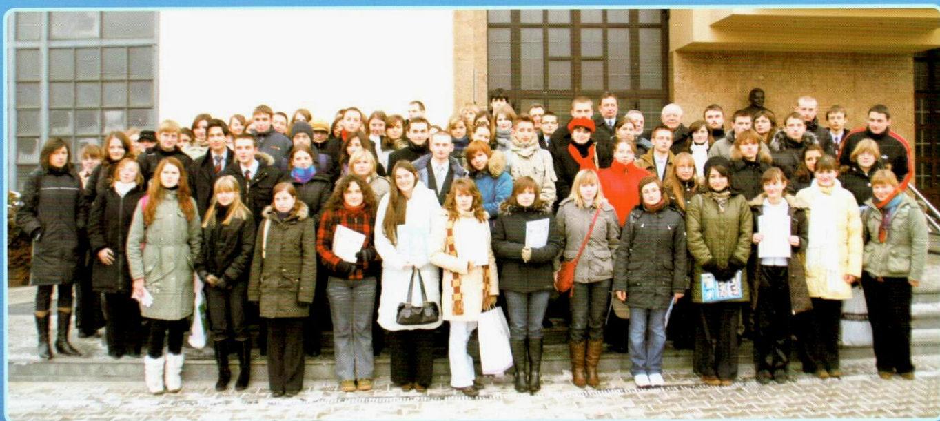
Stypendyści 2007 / 2008 szkół ponadgimnazjalnych.