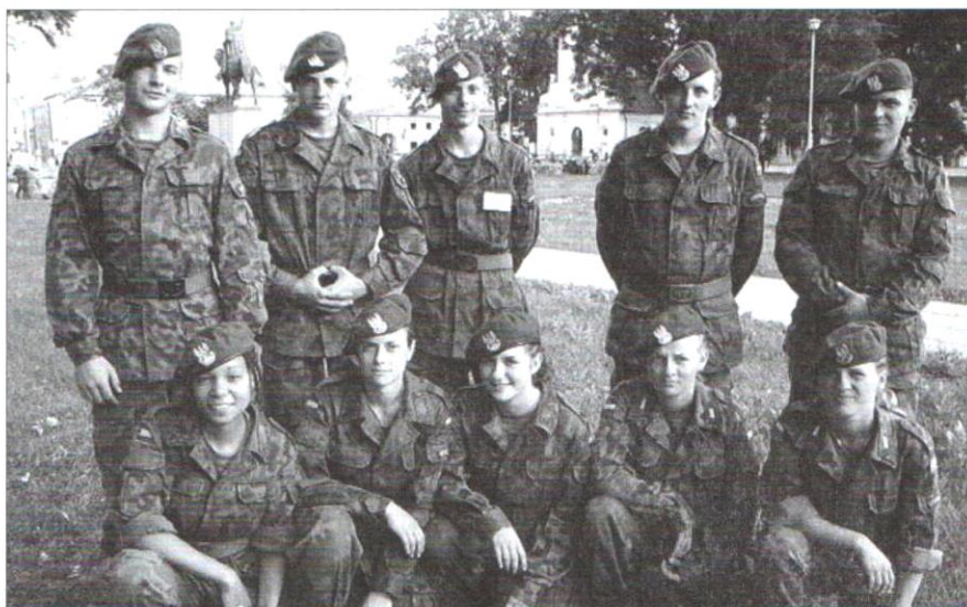
Zespoły strzelców biorący udział w mistrzostwach w Zamościu (2007 r.).

Jak co roku jarosławcy strzelcy wzięli udział w Mistrzostwach Sportowo - Obronnych Stowarzyszeń Młodzieżowych o Nagrodę MON wysyłając także zespół dziewczęcy. W przygotowaniach zespołów pomocy udzielili: 21 Brygada Strzelców Podhalańskich z Rzeszowa (szkolenia w Rzeszowie) w tym Jednostka Wojskowa 3957 z Jarosławia (szkolenia w Jarosławiu), Państwowa Straż Pożarna w Jarosławiu oraz Miejski Ośrodek Sportu i Rekreacji w Jarosławiu. Wspar-