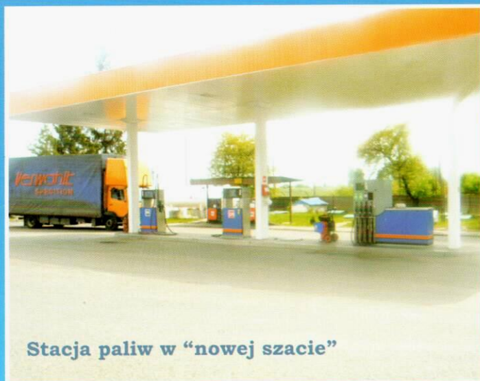
Stacja paliw w "nowej szacie"