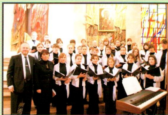
Chór z PSM w Jarosławiu