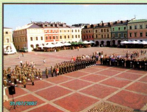
Strzelcy z JS2025 w Zamościu